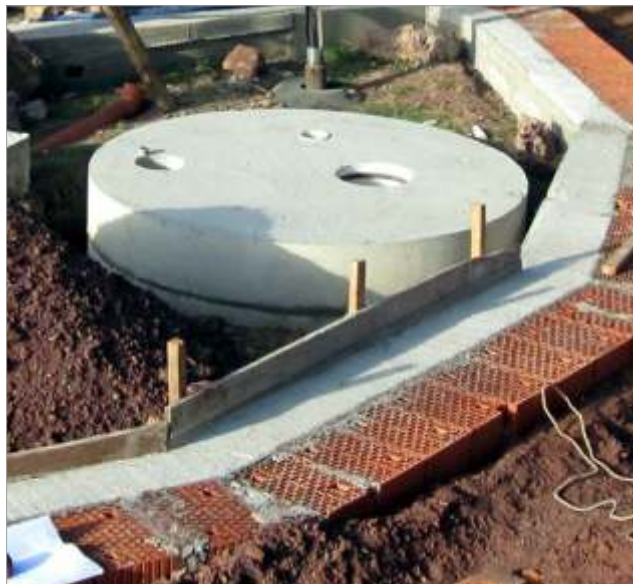
Das Beispiel zeigt eine GOLDGRUBE®/BG-GP innerhalb eines Neubaus mit Streifenfundamenten. Die Entnahmeöffnung wird sich im Eingangsbereich befinden und nicht sichtbar sein.

In der Bodenplatte sind die notwendigen Rohre und Öffnungen montiert.